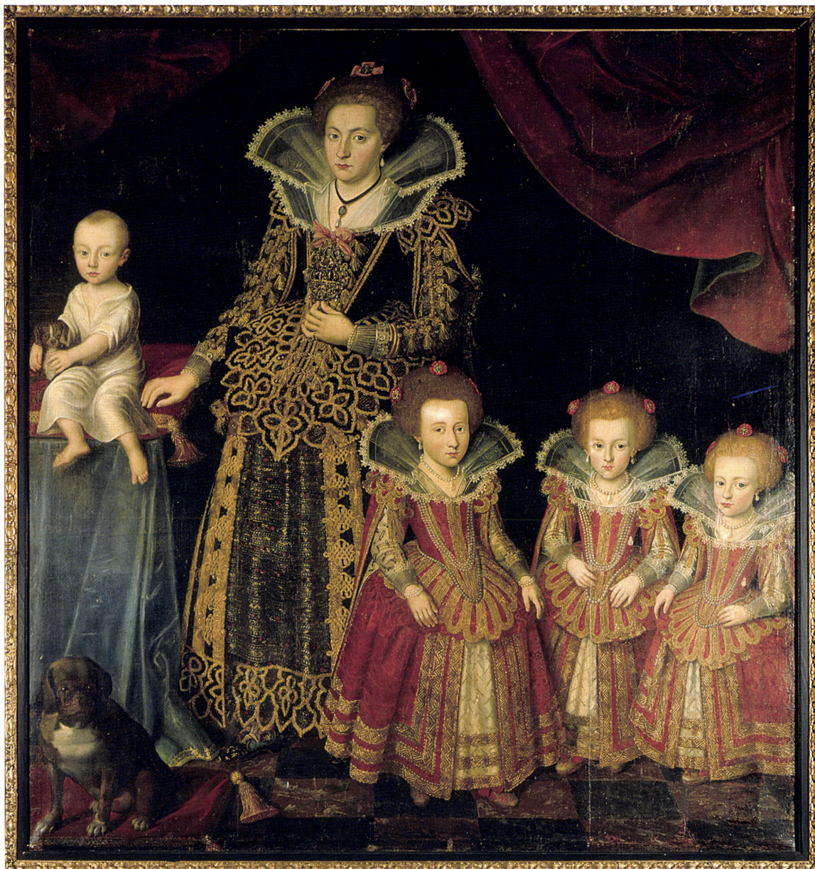
Jacob von Doordt: Kirsten Munk og fire af hendes børn med Christian IV, malet 1633. Privateje. Det Nationalhistoriske Museum på Frederiks- borg, Hillerød.