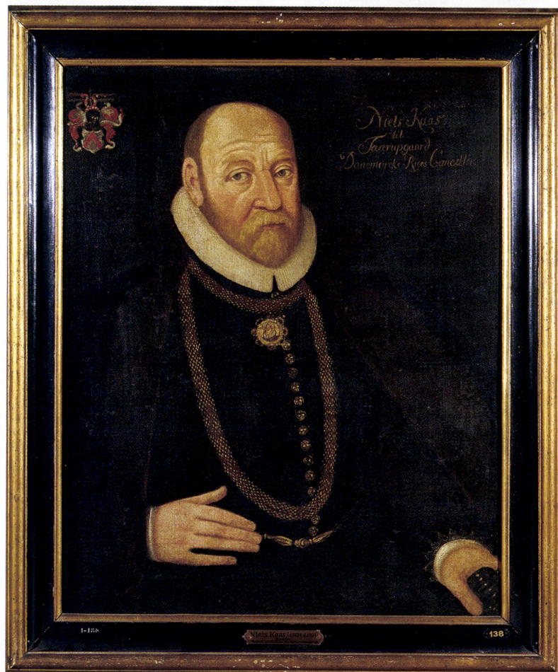
Rigsråd Niels Kaas til Tårupgård (1534-94). Maleri på Rosenborg

var han altså på én gang voksen og myndig i hertugdømmerne og umyndigt barn i monarkiet, hvor formynderregeringen – som Troels-Lund slående bemærkede – søgte at aflede hans virkestrang ved at bygge ham et legetøjsskib på Skanderborg sø.