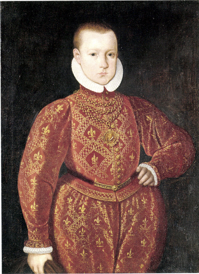
Chr. IV som ung prins, malet i begyndelsen af 1580'erne af den flamske maler Hans Knieper, som virkede i Danmark fra 1577 og indtil sin død i 1587. Rosenborg.

uden hver måneds optegnelser med en samlet opgørelse over månedens indtægter og udgifter. Med stadig større skarphed skelnede kongen mellem »sit eget« og »rigets«, og det afslører hos ham en tilbøjelighed til at betragte sin kongemagt nærmest som et gods og sig selv som gods-herre – en synsmåde, som givetvis ikke var uden forbindelse med formynderregeringens opdragelsesform og i nær familie med bogholderiprincipperne på adelens godser.